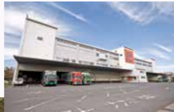
建物：3階建て 延床面積：約11,300坪

物流網・輸送面の発展や在庫の効率性を考え、物流拠点の集約を検討し店舗数の多い大都市エリアで品数の多い商品を取り扱うことが出来る場所を探していました。商品供給の効率性を考慮し、インターに近いなどの好立地が決め手となりました。「人に優しい」をコンセプトに環境面や省力化に配慮した、高品質な配送サービスを提供できるシステムを導入しています。