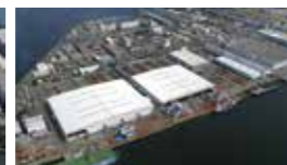
大阪物流センター(堺)