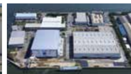
東京物流センター(市川)