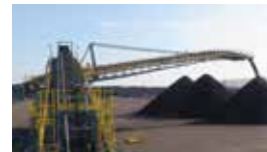
倉敷コールセンター