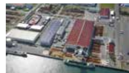
仙台物流センター