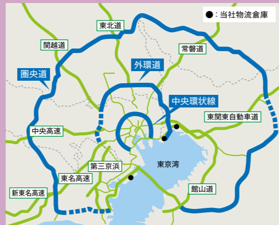
・圏央道(相模縦貫道) ※2020年全通予定