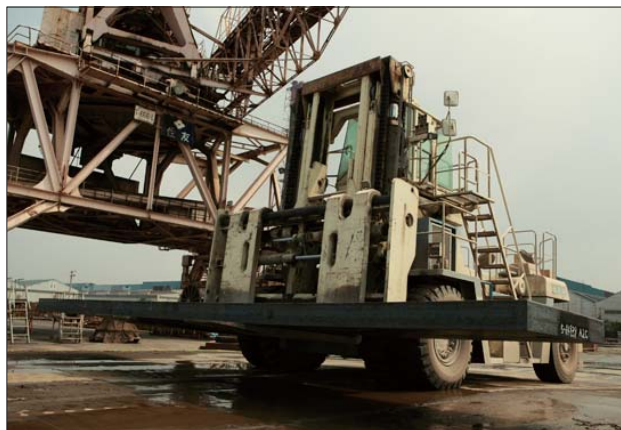
スラブを運ぶ際は、左右のバランスをとることも大切。

ちんと穴の中心に爪を通さないと、まっすぐ持ち上げられません。また、積荷を降ろす位置は、当の荷物によってほとんど見えない。こういうところは感覚勝負ですね。