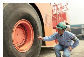
自分の体ほどもある大きさのタイヤを点検。