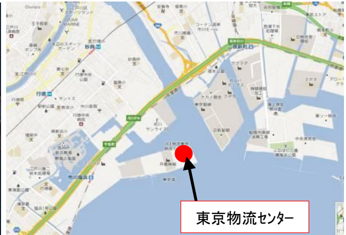
東京物流センター