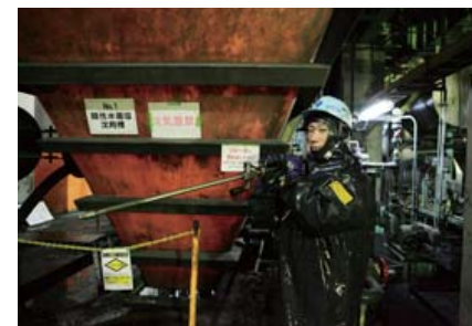
この日洗浄したのは、廃棄物処理施設の沈殿槽。狭い槽内に体を折り曲げて入っていくのも慣れたもの。

汚れの発生する場所を高圧洗浄車で巡り、堆積した汚れを落とす洗浄チーム。 製鉄所がいつでも正常に稼動するためには、彼らの存在が不可欠です。 両手で握った洗浄ガンを縦横無尽に操作するのは、 入社7年目の若きプロフェッショナルでした。